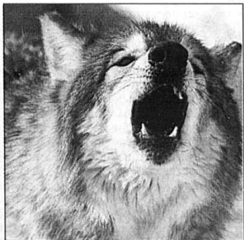
Ulven har tatt mindre sau i sommer.

■ Ulven har herjet mindre med saueflokkene denne sommeren i forhold til i fjor, skriver Nationen. Rovdyrbasen til Statens naturoppsyn viser at det er funnet 202 sauekadavre så langt i år der man er sikker eller nesten sikker på det er ulven som er synderen. I fjor ble det funnet 384 sauer som man tror var drept av ulv. Ifølge Statens naturoppsyns tall har både gaupe og bjørn tatt nesten like mange sauer som det ulven har. (NTB)