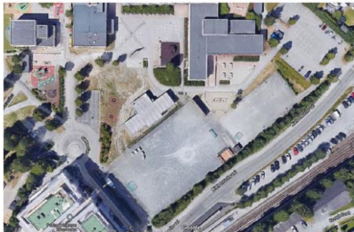
FRA GRÅTT OG KJEDELIG