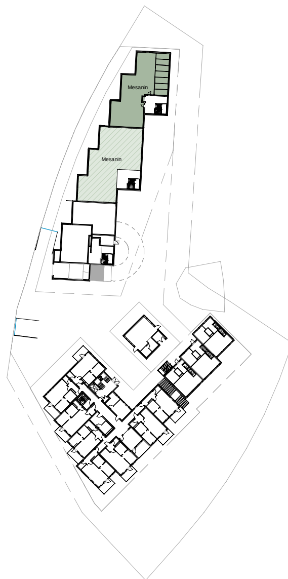
Plan 01 1 : 1000

Antall parkeringsplasser plan U1: 42 stk Antall parkeringsplasser plan 01: 2 stk