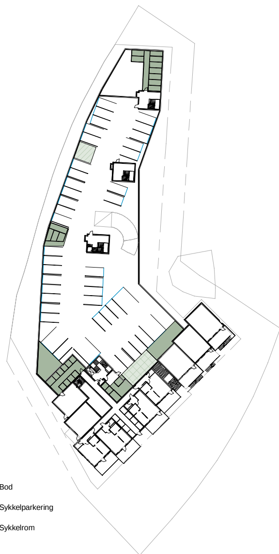
Plan U1 1 : 1000