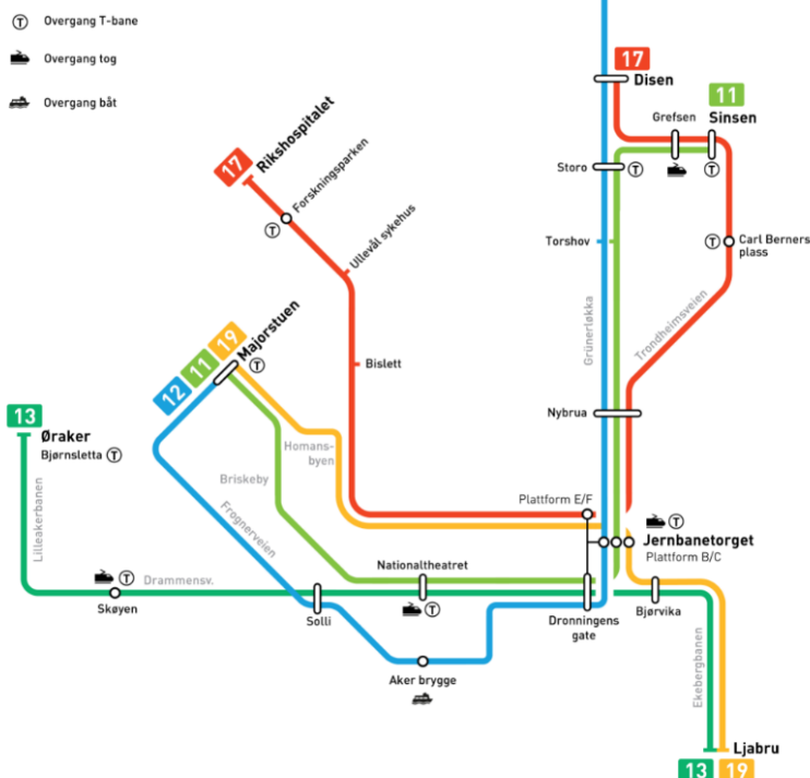
Figur 2 Anbefalt Rutemodell 2024

Det vil skje en trinnvis tilpasning til den nye rutemodellen i perioden 2021 – 2024. Rutemodellen må i denne perioden tilpasses det trikkemateriellet som til enhver tid er tilgjengelig. Første trinn i utviklingen mot ny rutemodell 2024 vil skje i august 2021 etter at Storgata er åpnet for trikk, og innebærer blant annet at Ekebergbanen kobles mot Stortorvet og Majorstuen (Figur 3). Planlagt antall avganger per time for de ulike linjene er i figuren vist med små firkanter langs linjene.