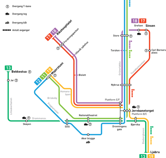
Figur 3 Første trinn i utviklingsplanen mot ny Rutemodell 2024