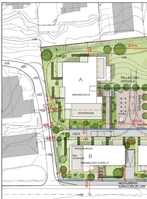
Illustrasjon: Østre Stabekk vel. Bygg A og B kommer veldig nær eksisterende småhusbebyggelse i Professor Kohts vei

Bygningsvolumene i planforslaget er brede lameller og ligger hovedsakelig med sine brede gavlfasader og henvende mot bakenforliggende bebyggelse. Dette vil for enkelte eiendommer fremstå som en massiv vegg rett mot respektive eiendommer med sjenerende innsyn i både boliger, terrasser, hager og øvrige uteoppholdsarealer. Østre Stabekk Vel er av den oppfatning at dersom bebyggelsen hadde vært mer fragmentert og bygget opp av mindre volumer med lavere høyder, så vil prosjektet i større grad kunne integreres i småhusområdet.