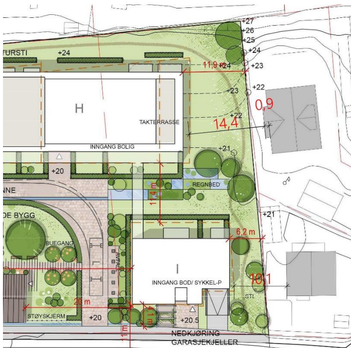
Illustrasjon: Østre Stabekk vel har lagt inn mål mellom ny og eksisterende bebyggelse. Bygg H og I kommer veldig nær eksisterende småhusbebyggelse i Ekeliveien.