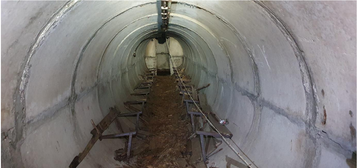
Figur 1: En av delene av anlegget på Fornebu hvor det er benyttet sivile bygningslementer fotografert 10.12.2020.