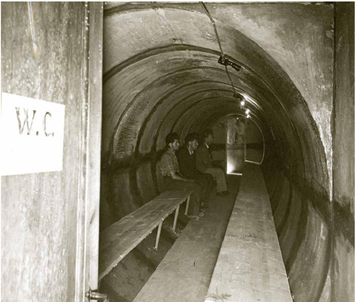
Figur 2: Bilde som viser et dekningsrom i Oslo som inspiseres av det Sivile Luftforsvaret og Oslo kommune.