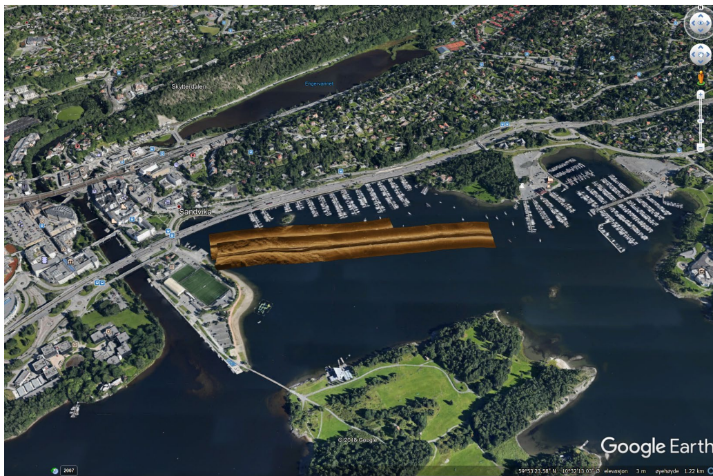
Figur 2 Dekning med sidesøkende sonar, Lakseberget i Bærum kommune