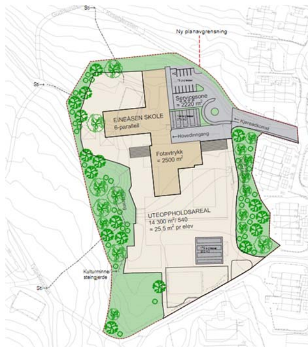
Figur 2: Illustrasjonsplan

Dette miljøprogrammet og overordnede miljøoppfølgingsplan (MOP) gjelder som et styrende dokument, og skal danne grunnlag for en miljømessig god planlegging og gjennomføring for transformasjon fra eksisterende Eineåsen skole avdeling Gommerud til nye Eineåsen 6-parallell ungdomsskole. Dokumentet følger i hovedsak Norsk standard NS3466:2009 Miljøprogram og miljøoppfølgingsplan for ytre miljø for bygg- og anleggs- og eiendomsnæringen .