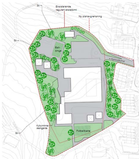
Figur 1: Dagens situasjon