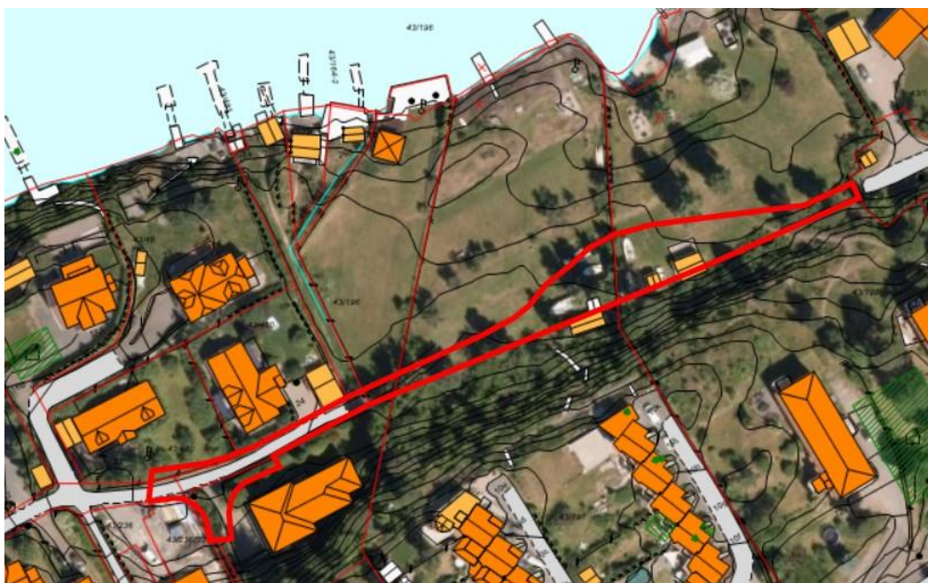
Flyfoto med påført planavgrensning , alternativ 2.

Forslag til offentlig detaljregulering for Borgenhaug- Kristian Kølles vei, planID 2016026, plankart dokument 4453408 og bestemmelser, dokument 4452741, vedtas, jf. plan- og bygningsloven § 12-12.