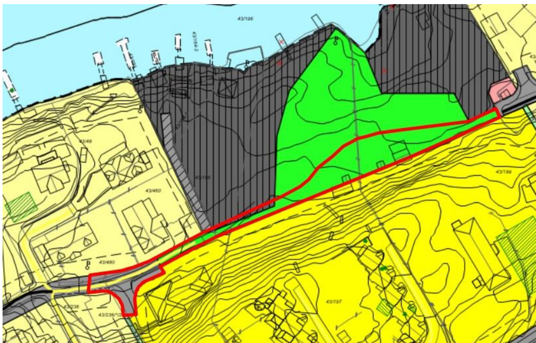
Gjeldene reguleringsplan påført planavgrensning for ny plan, alternativ 2

Den foreslåtte planavgrensningen for alternativ 2 muliggjør ulike traseer for turveien over det foreslåtte friområde. Rådmannen ønsker en fleksibilitet i gjennomføringen og en dialog med grunneiere i opparbeidelsesfasen; eksempelvis muliggjør planavgrensningen at turveien kan legges inn mot skråningen i sør og at eksisterende boder flyttes frem. Et annet alternativ kan være å legge turveien i en svak bue nord for bodene. Reguleringsbestemmelsen begrenser turveiens grusdekke til maksimalt 1,5 meter.