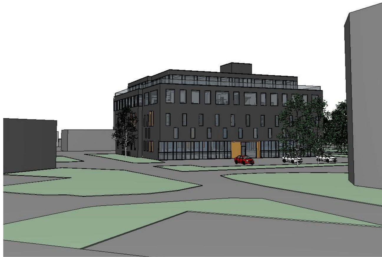
Fasade nord sett fra E16