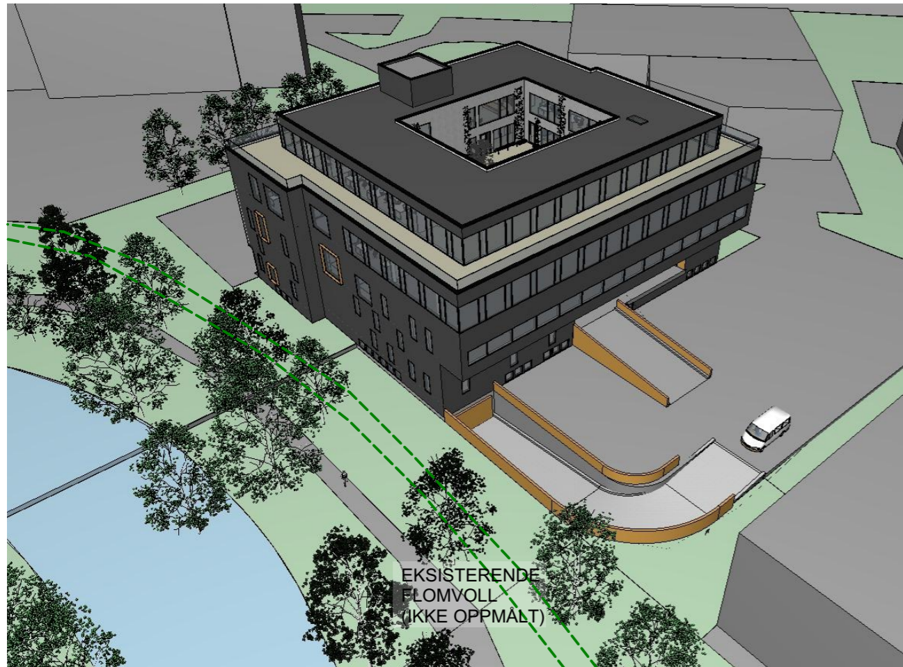
Fugleperspektiv,- Sandvikselva, rampeløsninger, atrium, takterrasse