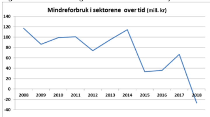
Figuren viser utviklingen i sektorenes mindreforbruk over tid.

Sektorenes resultater er etter en oppgang de siste årene blitt negativt i 2018. Dette antyder at eventuelle slakk i budsjettet er i ferd med å bli brukt opp, og at det er utfordringer med å få gjennomført enkelte innstrammings tiltak. Omstillingsbehovet øker i årene fremover og det må fortsatt fokuseres på å gjennomføre de vedtatte innstrammings tiltakene i tjenestene. Rådmannen vil følge dette særskilt opp. Som et første ledd i dette er det foretatt en risikoanalyse av tiltakene.