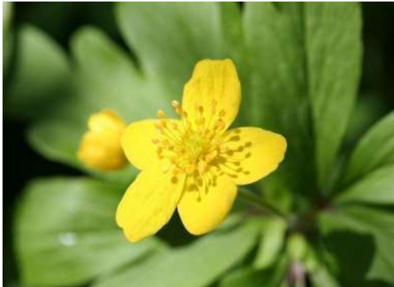
Gulveis: Bærum's kommuneblomst