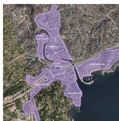
Anslag over arbeidsplasser i gangavstand fordelt på delområder

Lysakerbyen næringsvel og SPOR arkitekter AS beregnet i 2014 antall m 2 bruttoareal (BTA) og antall arbeidsplasser innenfor delområder på Lysaker. Avgrensingen av delområdene omfatter i grove trekk VPOR-området, med tillegg for kontorbebyggelsen på Drammensveien 206-264 (Hydro m.fl.) som ligger utenfor VPOR-området. Beregningen la til grunn et bruttoareal for alle områdene samlet på ca. 660 000 m 2 . Ut fra tallene fremgår det at ca. 90 % av arealene er benyttet til kontorformål. De øvrige 10 % er forretninger, bevertning osv. Det er beregnet totalt ca. 23 000 arbeidsplasser innenfor disse delområdene.