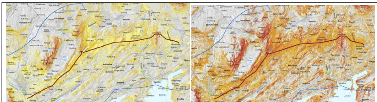
Utsnitt av synlighetskart som viser situasjon før og etter nytt luftspenn.

Luftspennalternativet skjønnes ved at de gjennomsnittlig 38 meter høye mastene betegnes som «designmaster». De 55 nye planlagte mastene vil bli de høyeste konstruksjonene/byggene i hele Bærum, så vel som i Ullern og Vestre Aker. Det nye luftspennet vil bli godt synlig fra store deler av Bærum og Oslo vest, vesentlig mer enn dagens luftledning, jfr. kartutsnitt under. Synligheten vil berøre både bebyggelses- og naturområder.