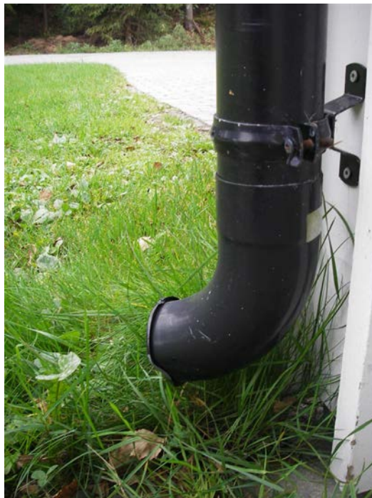
Frakoblede taknedløp kaster overvannet ut på plenen og reduserer tilførselen til avløpsnett

Å håndtere takvannet på egen eiendom gjennom å la takrennene gå med utkast på plen er en god måte å redusere tilførselen av rent vann til avløpsnett. Dermed reduseres også faren for kjelleroversvømmelse som følge av tilbakeslag. Et annet forhold som den enkelte huseier kan være bevisst på er å ikke asfaltere eller steinsette alt av innkjørseler og private parkeringsplasser. Hvis dette opprettholdes med grusdekke eller andre former for permeable dekker i stedet for å asfalteres eller hellelegges, opprettholdes muligheten for at noe av vannet kan infiltrere ned i grunnen.