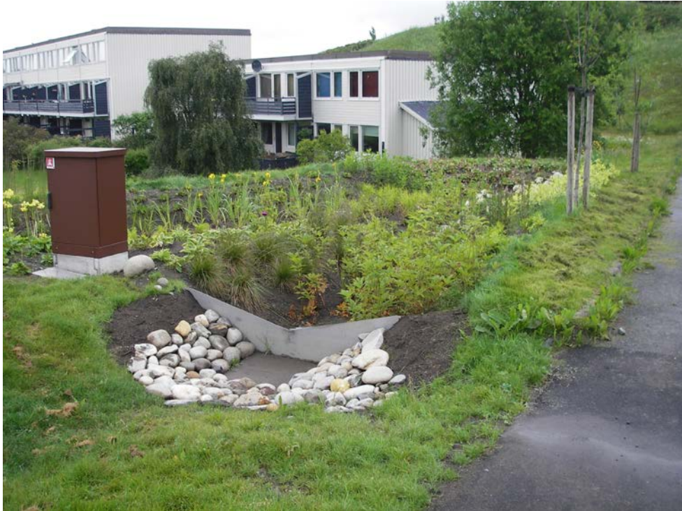
Eksempel på regnbed etablert i borettslag i Trondheim

Primært ønsker kommunen at fordrøyning av overvann skal gjøres i åpne løsninger, som f.eks regnbed eller midlertidig neddemming av tilpasset areal. Fra valgt fordrøyningsløsning kan en kontrollert mengde vann evt tilføres offentlig nett dersom det tillates. Det skal være god hydraulisk kontroll på vannmengden som videreføres til enten resipient eller offentlig ledningsnett. Vannføringen må være kontrollerbar. Det er viktig at løsninger for hvor vannet går når fordrøyningsløsningen går full er gjennomtenkt og at sekundære flomveier er etablert. Overløp til offentlig nett tillates ikke!