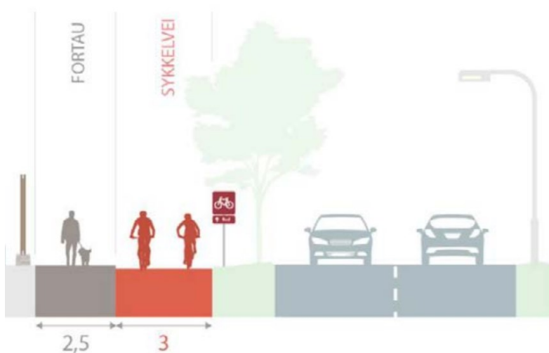
Figur 2. Normalprofil for planlagt sykkelvei med fortau.

Det skal etableres 3 m sykkelvei med 2,5 m fortau på sørsiden av Bærumsveien.