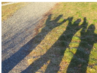
Bilde fra et prosjekt om lys og skygge.