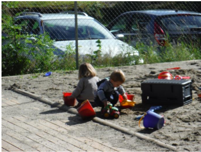
Lek i sandkassa