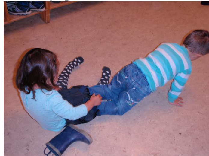
Barna hjelper hverandre