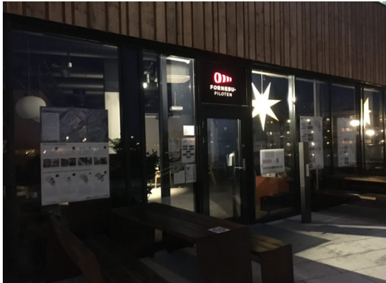
Utstillingen ble hengt opp både inne og i vinduene, så den var tilgjengelig uavhengig av åpningstid.

Ansatte fra planavdelingen og ansvarlige for bibliotek var til stede på Fornebupiloten i uke 50, primært, men også i uke 51. På grunn av smittevern var det ikke anledning til å arrangere «åpent kontor» her som ønskelig, og vi kunne heller ikke annonsere bredt at vi var til stede. Vi sendte ut epost direkte til interessenter om pågående prosess, mulighet for digitale møter mv. Dette ble sendt til klassekontakter/FAU, epostlisten fra spørreundersøkelsen, til barnehager, vel, sameier og grunneiere. På tross av at vi ikke fikk annonsere like bredt som ønsket, kom det flere innom, vi opplevde gode dialoger, mye toveis informasjonsutveksling og vi ga også informasjon på de få møtene som ble arrangert av andre på Fornebupiloten i dette tidsrommet.