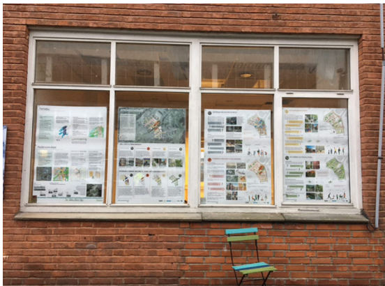
Utstilling av byplangrepet i Kulturgaten