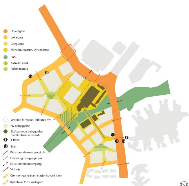
Byplangrep for flytårnområdet til 2.gangs behandling

Flytårnområdet er et pilotområde for nullutslippsområde gjennom forskningscenteret Zero Emission Neighbourhoods (ZEN) og forbildeprosjekt på områdenivå i FutureBuilt.