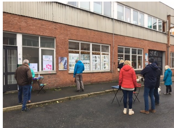
Første søndag i måneden, men ikke gjennomføring av julegate pga koronarestriksjoner