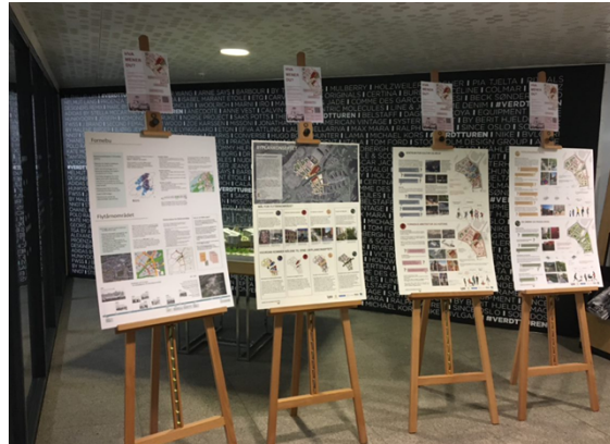
Utstillingen var også tilgjengelig på Fornebu S. Kjøpesenteret er et av få åpne steder pga smittevernsituasjonen.

Under følger en kortfattet oppsummering av ulike innspill som kom gjennom alle dialogene vi hadde i denne perioden: