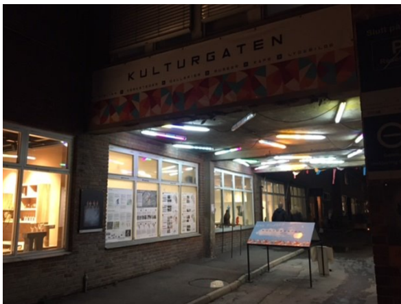
Utstillingen ble i etterkant flyttet til portalen i Kulturgaten, og ble hengende der til over nyttår.