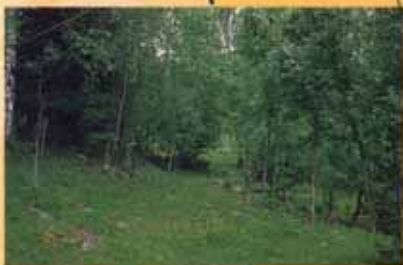
Middelalderveien Larshavna i Lommedalen