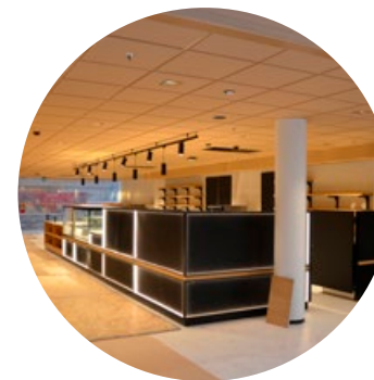
Kaffebaren ligger på området vi kaller Torget.