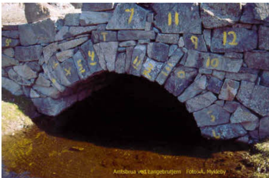
Amtsbrua ved Langebrutjern

Øvre Johnsrud ble kalt porten til Ringerike og herfra går vi inn i Krokskogen, beskrevet i Snorre som Kroka skogir. Leden følger stort sett den bergenske kongevei. Den ble anlagt av generalveitendant Peder Anker på 1790-tallet og begynnelsen av 1800-tallet. Kongeveien var en oppfølging av bestemmelsen fra 1786 om at hovedveiene skulle være kjørbare med hest og kjerre. Men allfarveien over skogen til Ringerike har vært brukt i uminnelige tider. Kong Magnus Lagabøter brukte den i 1276 og biskop Jens Nilssøns i 1594. Simensolla ligger nær Simensplassen. Den har vært en sikker vannkilde også for folk som har ferdes etter veien. Leden passerer Fellesbonn, et av de utallige minnene i marka etter kullbrenningen som skaffet kull til Bærum Verk. Kullbrenning var selve livsnerven i skogsfolkens økonomi så lenge jernverket var i drift; 1610-1872.