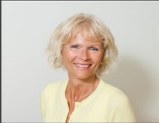
Siv Herikstad Oppvekst og skole