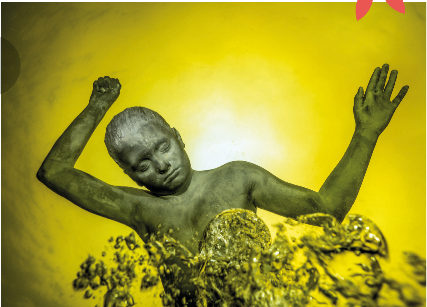
Sjøholmen Barnekunsthus i Sandvika/Bærum, kurator Suki Loftheim. Skulptur og foto: Jason Taylor.